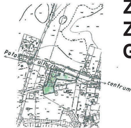
Szkic orientacyjny skala 1 : 10000